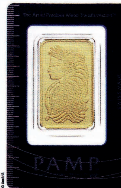
Le lingot d'une once (31,1 grammes) PAMP, la notoriété de la Lady Fortuna !